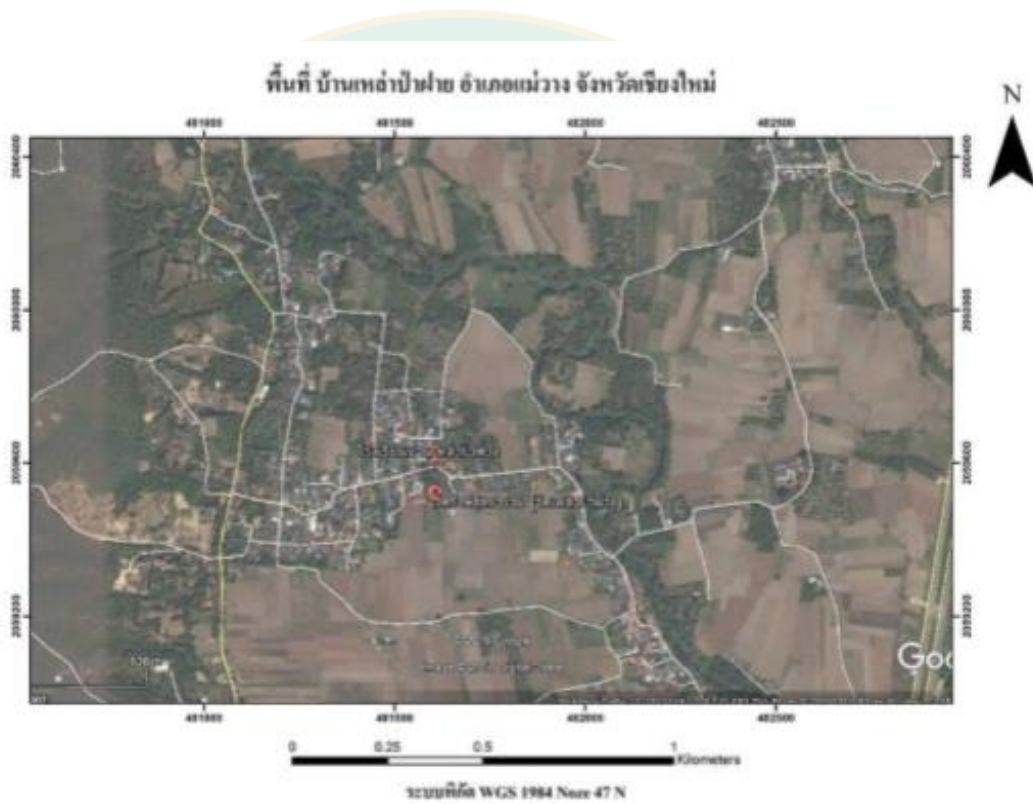
ภาพที่ 1 แผนที่หมู่บ้านเหล่าป่าฝาง ตำบลดอนเปา อำเภอแม่อาง จังหวัดเชียงใหม่

หมู่บ้านเหล่าป่าฝางหมู่ 2 ตำบลดอนเปา อำเภอแม่อาง จังหวัดเชียงใหม่ (สถานที่ปลูกหอมหัวใหญ่ของ เกษตรกร