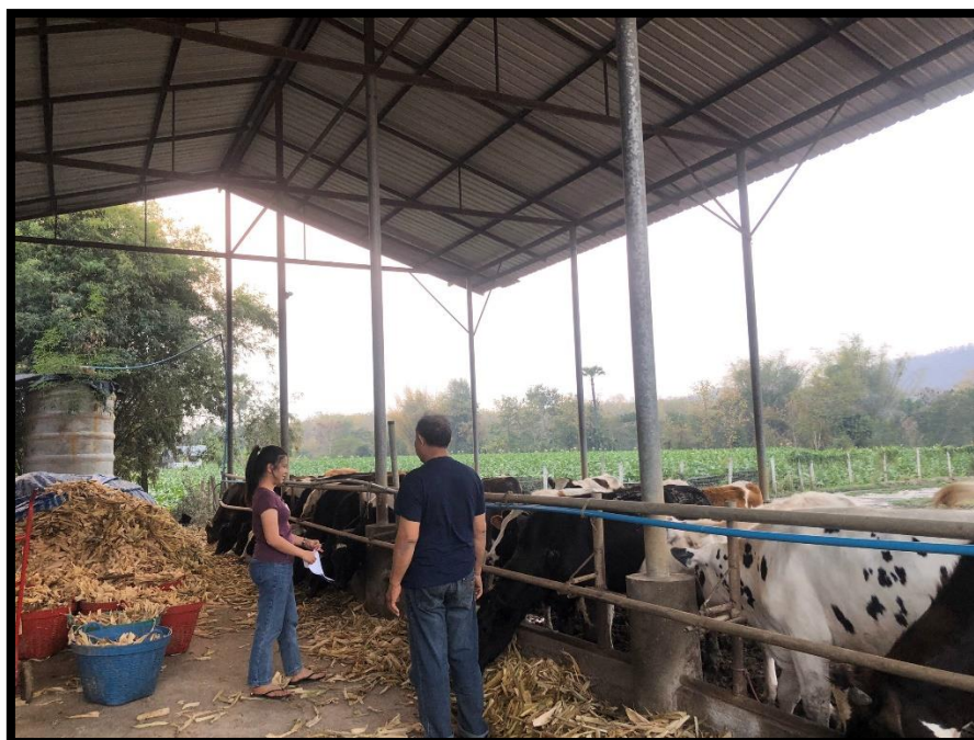
ภาพผนวกที่ 1 สอบถามเกษตรกรผู้เลี้ยงโคนม