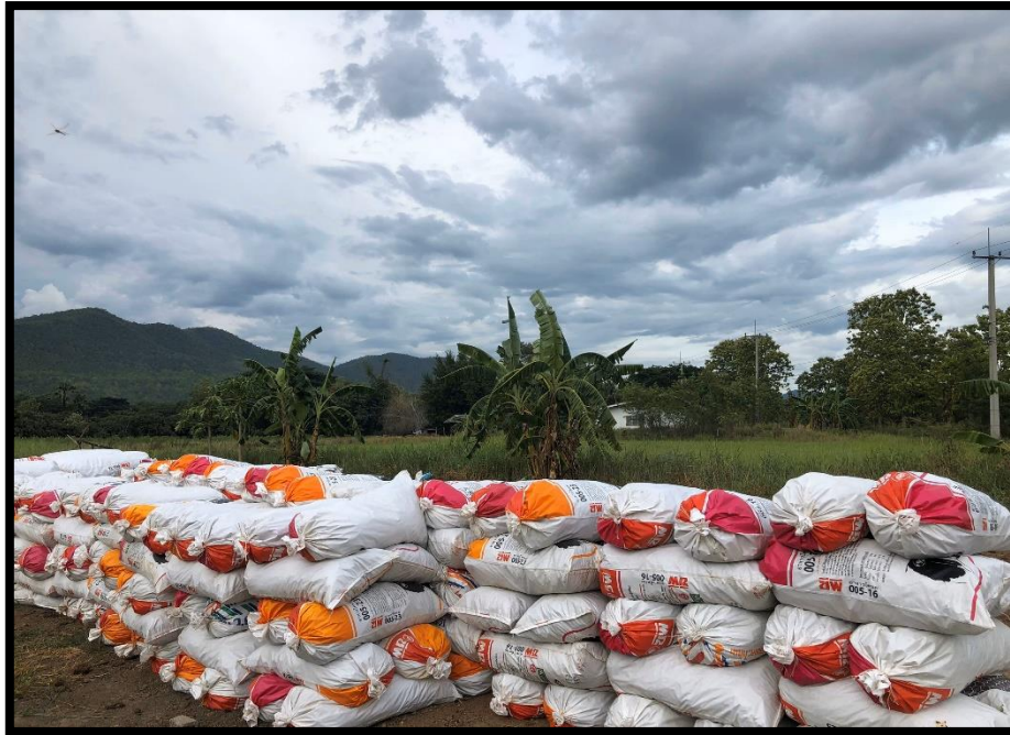
ภาพผนวกที่ 7 มูลโคนม