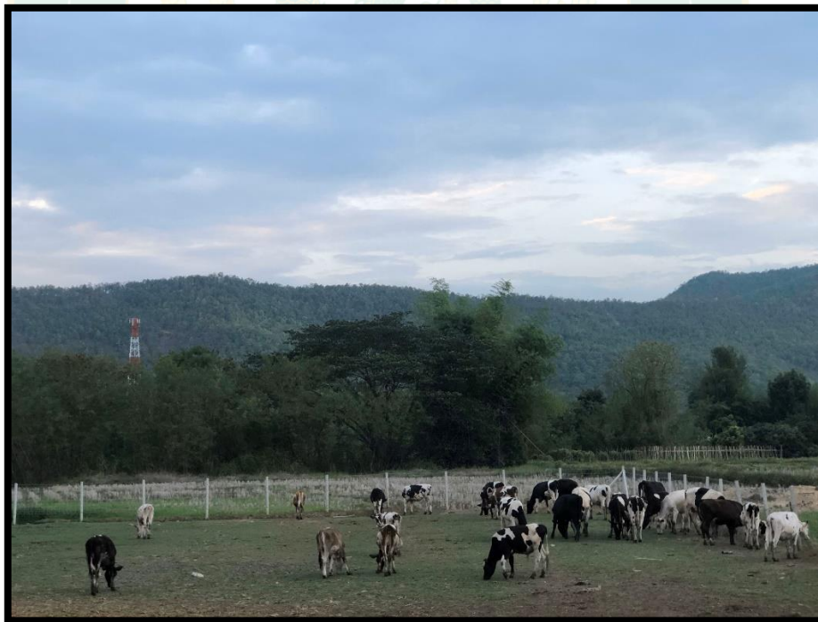
ภาพผนวกที่ 6 การเลี้ยงโคนมแบบปล่อยอิสระในคอก