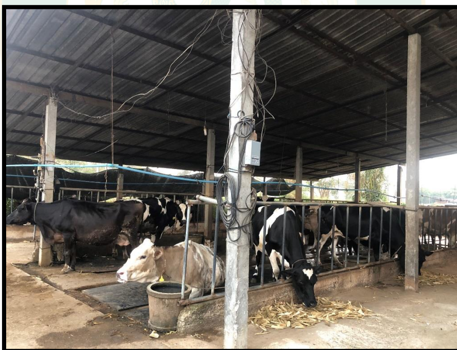
ภาพผนวกที่ 2 ฟาร์มเลี้ยงโครีดนม