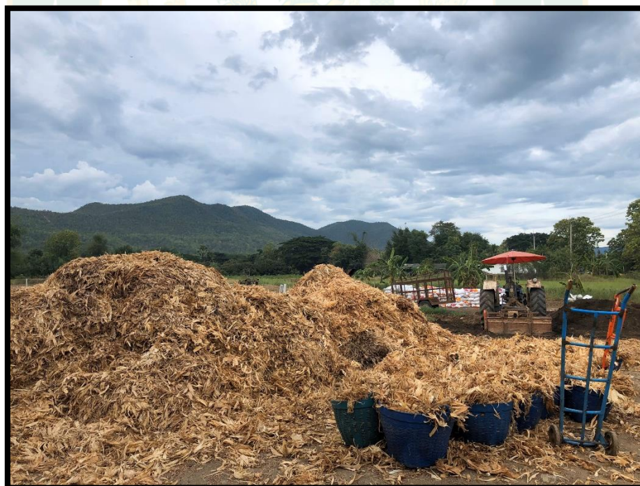
ภาพผนวกที่ 4 เปลือกข้าวโพดแห้งอาหารหยาบสำหรับโคนม