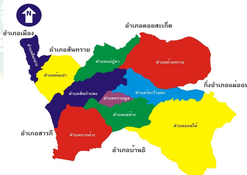
ภาพที่ 2 แผนที่อำเภอสันกำแพง จังหวัดเชียงใหม่

การวิจัยครั้งนี้ดำเนินการวิจัยในเขตพื้นที่อำเภอสันกำแพงและอำเภอแม่อน จังหวัดเชียงใหม่ เหตุผลที่เลือกพื้นที่ในการดำเนินการวิจัย เนื่องจากเกษตรกรในพื้นที่เลี้ยงโคนมจำนวนมาก เพราะ มีภูมิประเทศเป็นทั้งภูเขาและที่ราบลุ่ม มีความอุดมสมบูรณ์ ซึ่งเหมาะกับการเลี้ยงโคนม