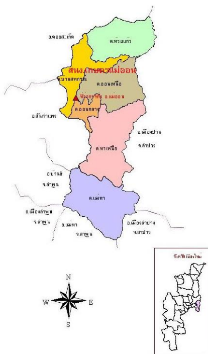
ภาพที่ 3 แผนที่อำเภอแม่ฮ่องสอน จังหวัดเชียงใหม่