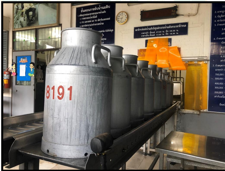
ภาพผนวกที่ 8 ศูนย์รวบรวมน้ำนมดิบ