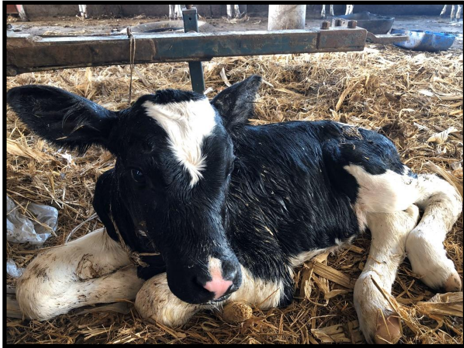
ภาพผนวกที่ 5 ลูกโคนมแรกเกิด