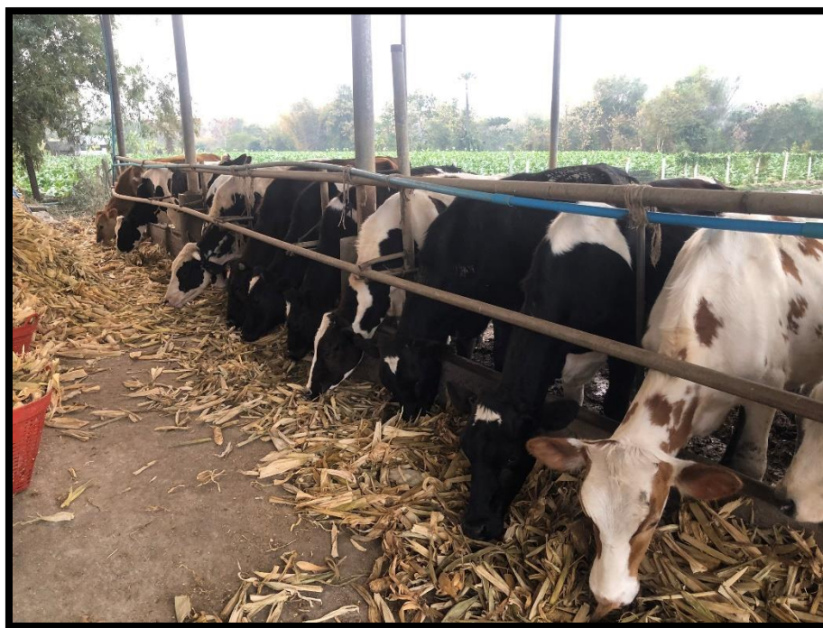
ภาพผนวกที่ 3 ฟาร์มเลี้ยงโคสาว