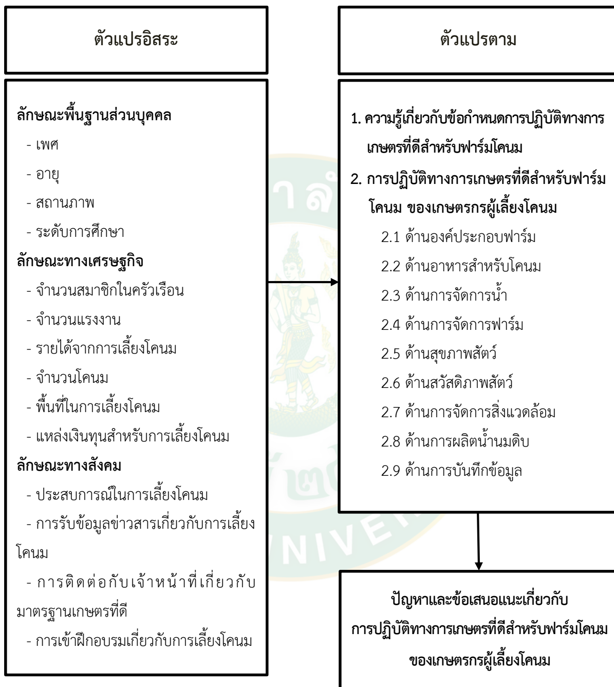
ภาพที่ 1 กรอบแนวคิดในการวิจัย