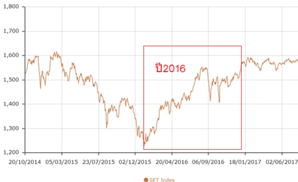
ภาพที่ 1 แสดงดัชนีราคาตลาดหลักทรัพย์แห่งประเทศไทย ตั้งแต่วันที่ 20 ตุลาคม 2014 ถึง 10 สิงหาคม 2017

นั้นดัชนีขึ้นไปทำจุดสูงสุดที่ 1,558.32 จุด เมื่อวันที่ 15 ส.ค. 59 หลังจากลงไปจุดต่ำสุดของปีที่ 1,220.96 จุด เมื่อวันที่ 11 ม.ค. 59 มีมูลค่าการซื้อขายเฉลี่ยต่อวันราว 5 หมื่นล้านบาท (กรุงเทพฯ ธุรกิจ, 2559)