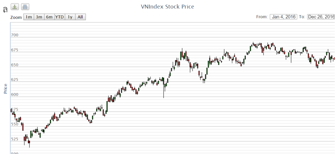
ภาพที่ 2 แสดงดัชนีราคาตลาดหลักทรัพย์โฮจิมินห์ ตั้งแต่วันที่ 4 มกราคม 2016 ถึง 26 ธันวาคม 2016

ดัชนีขึ้นไปทำจุดสูงสุดที่ 688.55 จุด เมื่อวันที่ 29 ก.ย. 59 หลังจากลงไปจุดต่ำสุดของปีที่ 522.24 จุด เมื่อวันที่ 22 ม.ค. 59