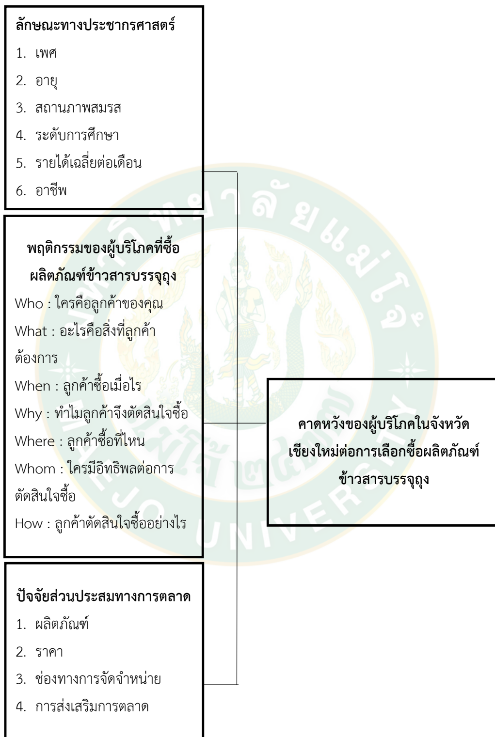
ภาพที่ 2 กรอบแนวคิดในการวิจัย