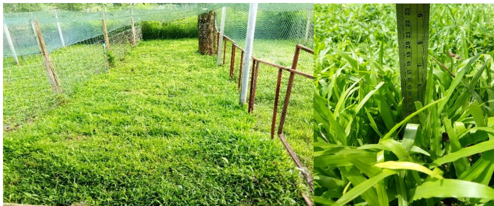
ภาพที่ 3 แปลงหญ้ามาเลเซียในการเลี้ยงไก่แบบปล่อยอิสระ