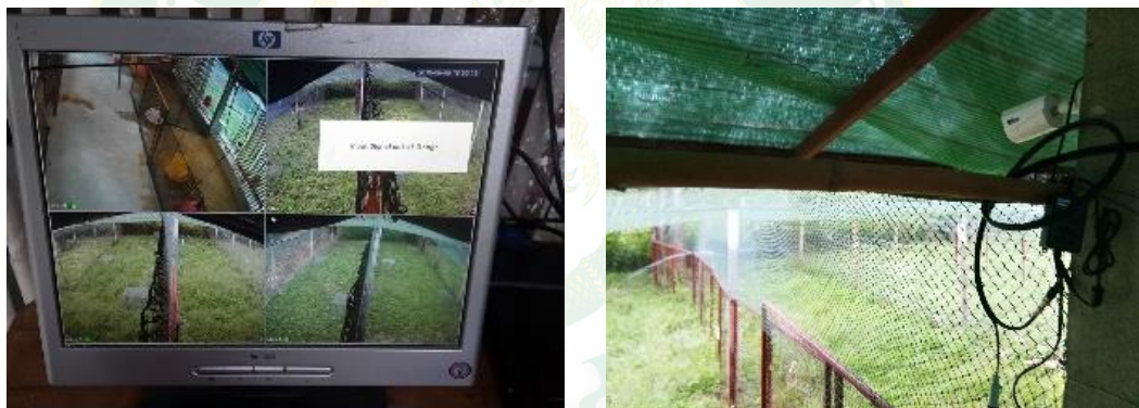
ภาพที่ 9 การบันทึกพฤติกรรมไก่ในโรงเรือนด้วยกล้องวงจรปิด