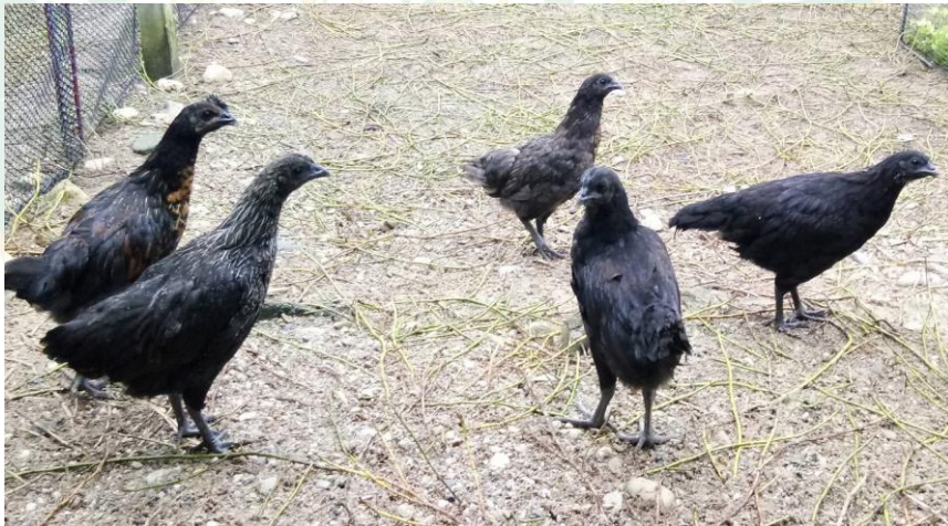
ภาพที่ 1 ไก่กระดูกดำ

ไก่กระดูกดำเป็นไก่พื้นเมืองที่นิยมเลี้ยงและบริโภคในพื้นที่ภาคเหนือตอนบน เช่น เชียงใหม่ เชียงราย แม่ฮ่องสอน เป็นต้น และมีแนวโน้มที่จะพัฒนาให้เป็นสัตว์เศรษฐกิจในระดับเกษตรกรรายย่อยได้ดีในอนาคต ปัจจุบันเนื้อของไก่กระดูกดำเป็นที่นิยมของผู้บริโภคโดยเฉพาะในหมู่ชาวจีนฮ่อ ม้ง และชาวเขาอีกหลายเผ่า รวมถึงคนไทยบางส่วนก็ยังนิยมใช้ไก่กระดูกดำในทางด้านพิธีกรรมตามความเชื่อ อีกทั้งใช้บริโภคเพื่อบำรุงร่างกายด้วย เนื่องจากมีความเชื่อทางด้านยาสมุนไพรเป็นอาหารบำรุงร่างกายเพื่อช่วยให้มีอายุยืน จึงทำให้ไก่กระดูกดำมีราคาแพงกว่าไก่พื้นเมืองสายพันธุ์อื่นและได้รับความสนใจมากขึ้น แต่ไก่กระดูกดำยังคงมีการเลี้ยงกันน้อยมากจึงไม่เพียงพอต่อความต้องการ รวมทั้งสายพันธุ์แท้ของไก่กระดูกดำก็หายากอีกด้วยเช่นกัน