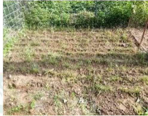
ภาพที่ 5 การเตรียมแปลงพืชอาหารสัตว์