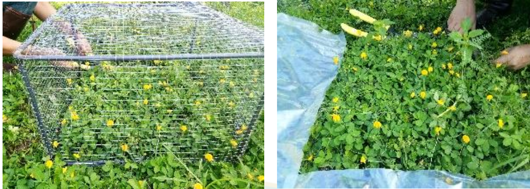
ภาพที่ 8 การตัดพืชเพื่อคำนวณผลผลิตพืชอาหารสัตว์ในแปลง