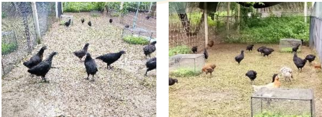
ภาพที่ 10 ลักษณะแปลงพืชอาหารสัตว์หลังปล่อยไถ่ลง