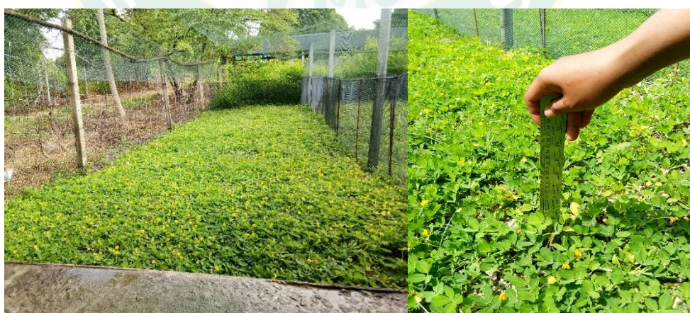
ภาพที่ 2 แปลงถั่วบราซิลในการเลี้ยงไก่แบบปล่อยอิสระ

ประโยชน์ของถั่วลิสงเถาฟลอริกา มีหลากหลาย อาทิ ใช้เป็นอาหารหยาบคุณภาพดีในรูปถั่วสดโดยตัดให้กินหรือปล่อยให้สัตว์แทะเล็ม และในรูปถั่วแห้งสำหรับเลี้ยงโคนม โคเนื้อ กระบือ แพะ แกะ ม้า และกระต่าย ใช้เป็นวัตถุดิบแหล่งโปรตีนในการผสมอาหารชั้นสำหรับสุกรและสัตว์ปีก การจัดทำแปลงหญ้าผสมถั่วสามารถปลูกร่วมกับหญ้าได้หลายชนิด อาทิ หญ้าแพงโกลา หญ้ารูซี่ อีกทั้งยังปลูกเพื่อป้องกันการพังทลายของหน้าดินและปลูกเป็นไม้ประดับได้อีกด้วย