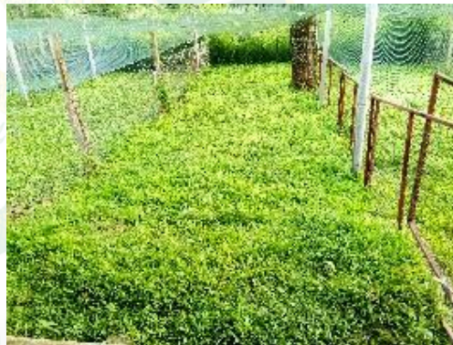
ภาพที่ 6 ลักษณะแปลงพืชอาหารสัตว์ก่อนปล่อยไถ่ลงแปลง