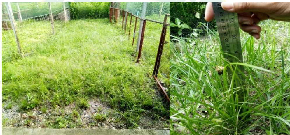
ภาพที่ 4 แปลงหญ้าแห้วหมูในการเลี้ยงไก่แบบปล่อยอิสระ

อาหารนกได้ และมีการนำมาใช้ผสมยาลูกหมากแห้งหรือแบ่งเหล่าในการทำเป็นแอลกอฮอล์เพราะมีคุณสมบัติทำให้เกิดแก๊สเร็ว สำหรับการใช้ประโยชน์ แม้ว่าการศึกษาหญ้าแห้วหมูเพื่อเป็นอาหารสัตว์ยังมีข้อมูลจำกัด เนื่องจากอาจมองเห็นว่าหญ้าแห้วหมูเป็นเพียงวัชพืช แต่ก็มีการศึกษาของ Bomgbooses et al. (2003) แสดงให้เห็นว่าการใช้ Tigernut meal ( Cyperus rotundus L) ทดแทนเมล็ดข้าวโพดบดที่ระดับ 33.3% DM ในอาหารไก่เพศผู้ (Cockerel starter) จะไม่ทำให้คุณภาพซากของไก่แตกต่างกับการเลี้ยงด้วยเมล็ดข้าวโพด แต่จะช่วยลดต้นทุนค่าอาหารลงได้ถึง 4.88% นอกจากนี้ ยังมีการศึกษาวิจัยในเชิงเภสัชศาสตร์ที่แสดงให้เห็นว่าหญ้าแห้วหมูโดยเฉพาะในส่วนของหัวมีคุณสมบัติทางยาหลายประการ เช่น ช่วยขับลม ลดการอักเสบและยับยั้งการเจริญเติบโตของเชื้อแบคทีเรีย เป็นต้น (ศิริวัฒนา, 2557)