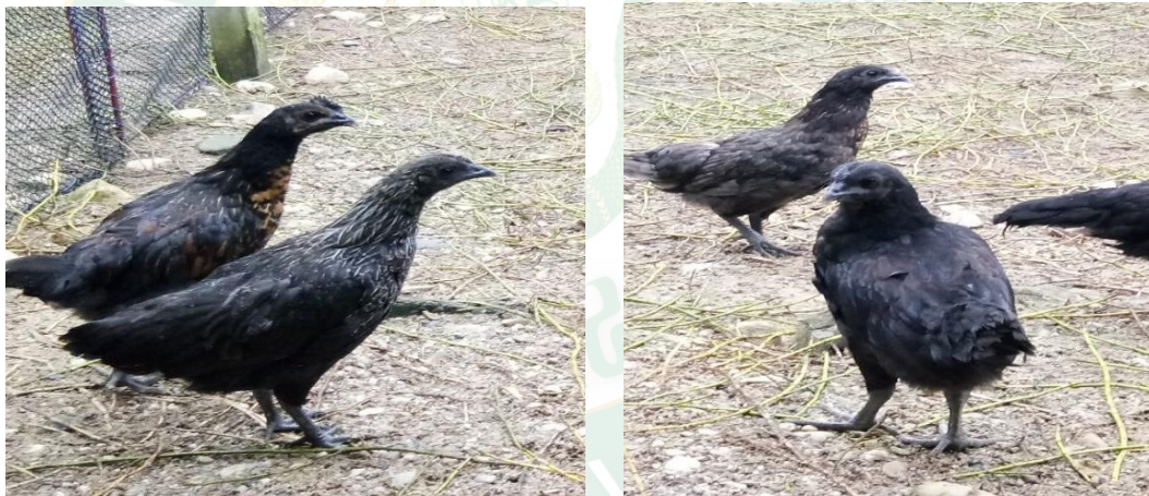
ภาพที่ 12 ลักษณะของไก่ที่เลี้ยงแบบปล่อยอิสระ