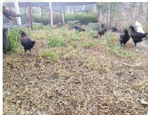
ภาพที่ 7 ลักษณะแปลงพืชอาหารสัตว์ระหว่างปล่อยไถ่ลงแปลง