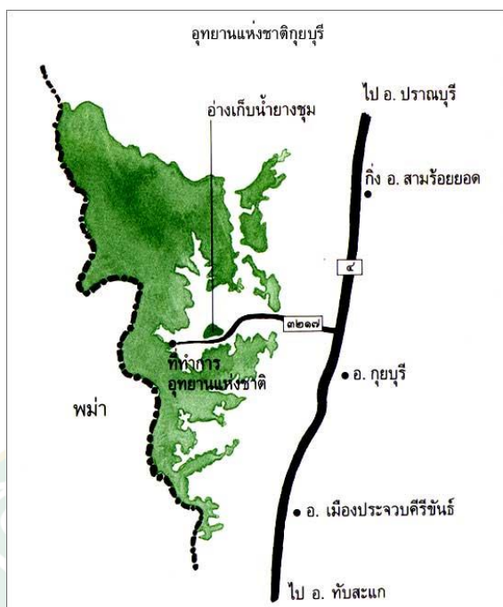
ภาพที่ 2 แผนที่อุทยานแห่งชาติกุยบุรี