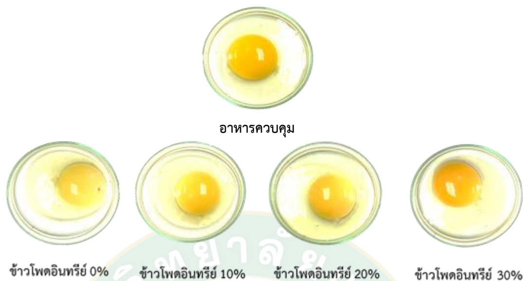
ภาพที่ 2 ผลของอาหารทดลองต่อสีของไข่แดง