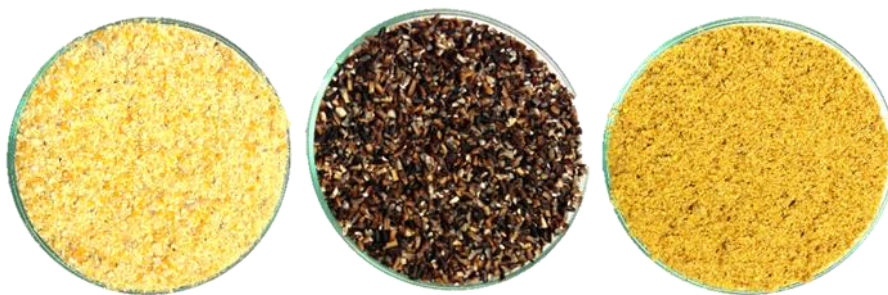
ภาพที่ 1 ข้าวโพดอินทรีย์ ปลายข้าวอินทรีย์และข้าวกล้องไขมันเต็มอินทรีย์