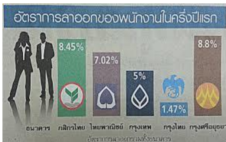
ภาพที่ 1 แสดงอัตราการลาออกของพนักงาน