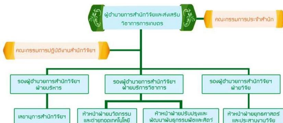
ภาพที่ 2 โครงสร้างและระบบการบริหารของสำนักวิจัยฯ