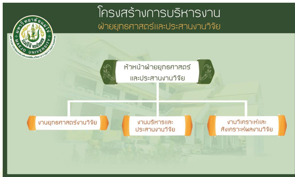
ภาพที่ 3 โครงสร้างการบริหารงาน ฝ่ายยุทธศาสตร์และประสานงานวิจัย

3. งานวิเคราะห์และสังเคราะห์ผลงานวิจัย รวบรวม วิเคราะห์และสังเคราะห์ผลงานวิจัย เพื่อการเผยแพร่และการนำไปใช้ประโยชน์