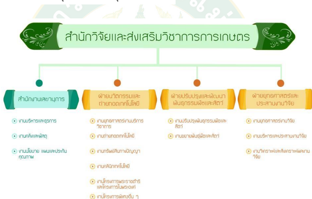
ภาพที่ 1 โครงสร้างและหน่วยงานภายในของสำนักวิจัยฯ