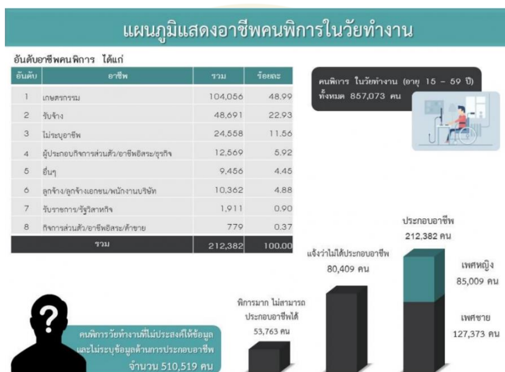
ภาพที่ 2 แผนภูมิแสดงอาชีพคนพิการในวัยทำงาน